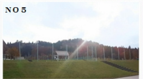
審り選してたらテニスの時間に遅刻!(もう15:00)