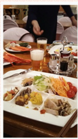
お楽しみのバイキング