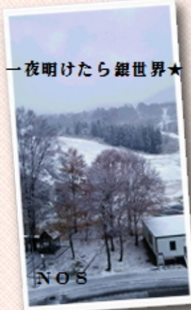
一夜明けたら銀世界★